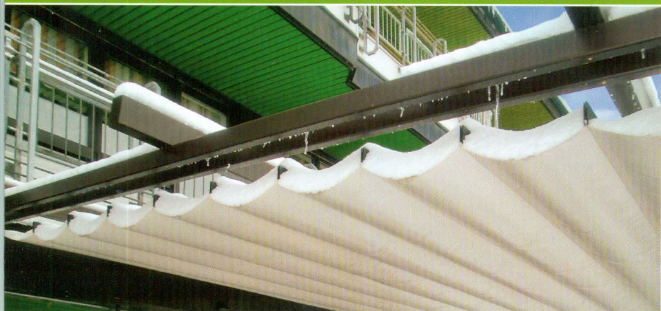
▲ Pergola aus Holz. Lucas-Raff-Baldachine sind so stabil, dass sie auch mal dem Winter trotzen.

Markenacryl oder PVC-beschichtetes Polyestergerewebe