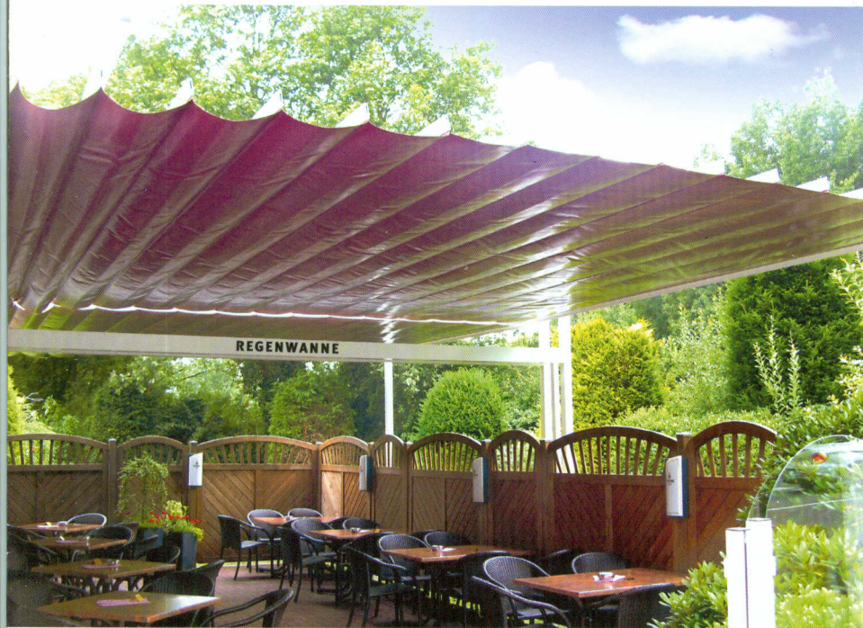
▲ Pergolagestell: Alu mit Regenwanne und Fallrohr Baldachin: PVC-beschichtetes Polyestergerewebe