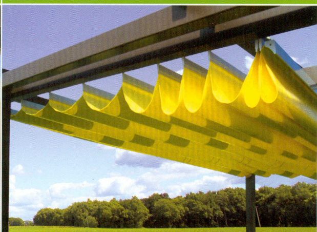
▲ Pergola aus Holz (Fichte) im Farbton „ebenholz“ lasiert. Behangmaterial: PVC-beschichtetes Polyestergerewebe zum Schutz gegen Sonne und Regen